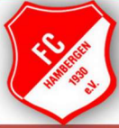
Tabelle der Kreisliga OHZ