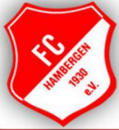
Tabelle der Bezirksliga 3